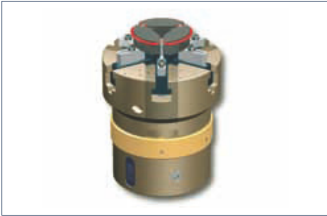
1. Aufnahme des O-Rings