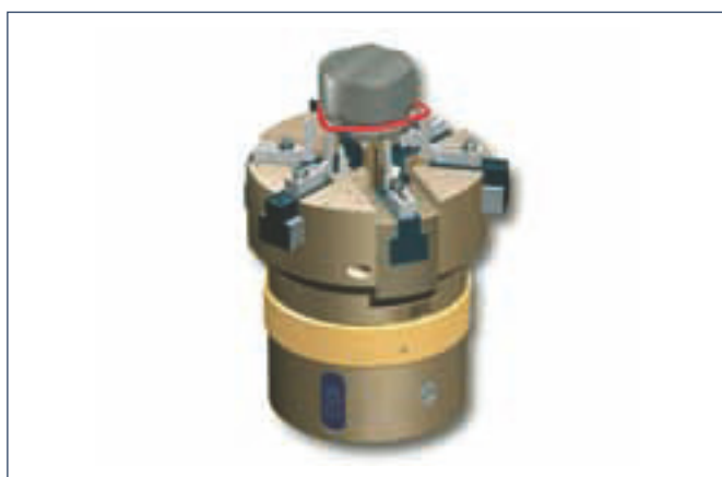
3. Zurückziehen von Backentripel A. Der O-Ring legt sich in die Nut ein