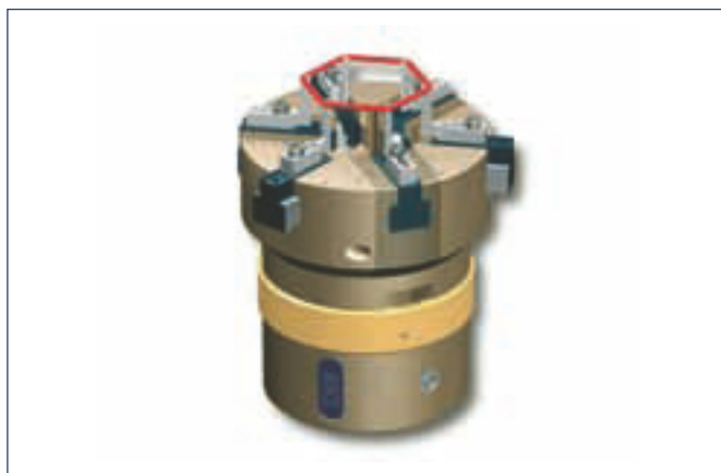
1. Aufnahme des O-Rings und Aufdehnen zum Sechseck