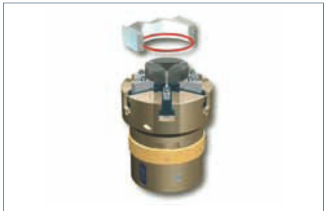
4. Eindrücken durch Backentripel A und Rückzug des Greifers