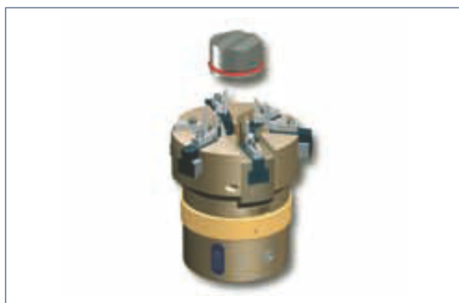
4. Zurückziehen des gesamten Greifers. Der O-Ring befindet sich nun komplett in der Nut