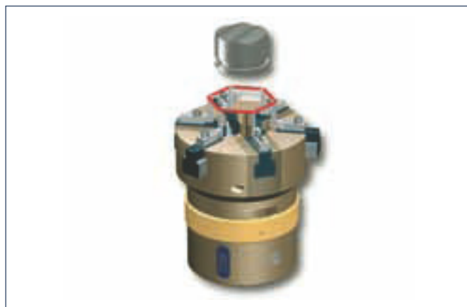
2. Fahrt zur Welle (Montageposition)