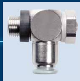
Drosselrückschlagventil- Verschraubungen DRV