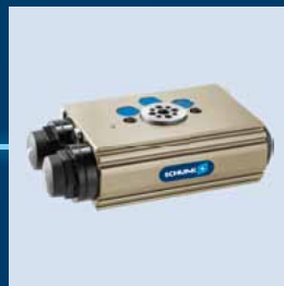
Universalschwenk- einheit SRU-plus