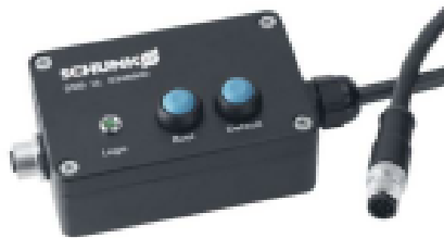
Abbildung 3: SSB - SCHUNK Service Box

Müssen allerdings außer der seriellen Kommunikation (s. USB-Kabel ) weitere externe Signale angeschlossen werden, zum Beispiel ein externer Referenzierschalter, bietet diese Box Vorteile.