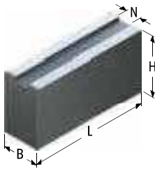
ungebohrt 1 | undrilled 1