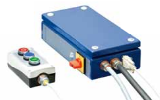
Steuereinheit KSS 01 380 / 400 V – 50 / 60 Hz